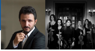
Umut Kosman, bariton

Konserlerimizde ses ve görüntü kaydı yapılmaktadır. Seslendirilen eserlerin bazıları birkaç bölümden oluşmaktadır. Eserin tümü bittikten sonra alkışlamanız bizlere kolaylık sağlayacaktır. Aynı nedenle konser esnasında cep telefonlarınızı tamamen kapatmanızı ve flaşla fotoğraf çekmemenizi rica ederiz.